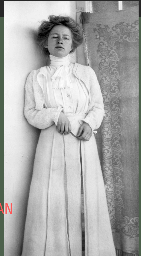
Selbstportrait, Edith Södergran

Das macht ihre Dichtung so aktuell: Aufrechte und Durchbruch zu spiritueller Weite gewinnt sie durch ihr Ringen "Zwischen Feuer und Wasser, ehrlich vereint in freiem Entschluss."